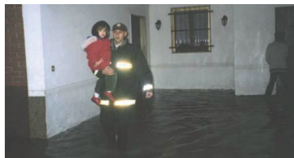
26 novembre 2002: il providenziale intervento della Protezione Civile