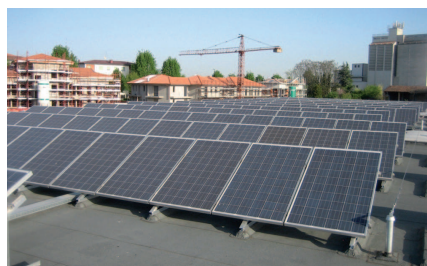
Solare: I nuovi pannelli fotovoltaici per un investimento nel solare